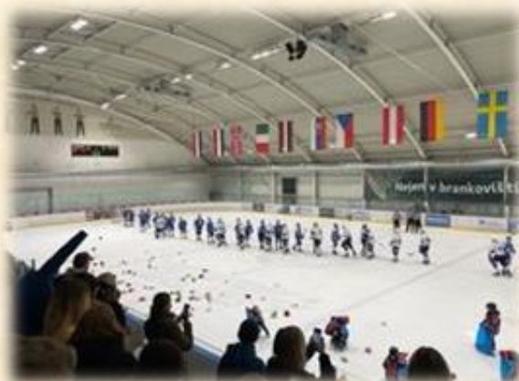
校際冰上曲棍球比賽