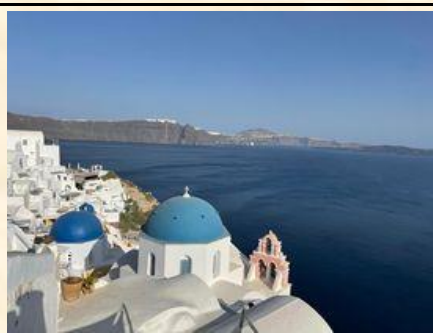
希臘：地理課本上浪漫的聖托里尼