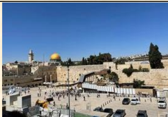
以色列：三教根源聖地耶路撒冷