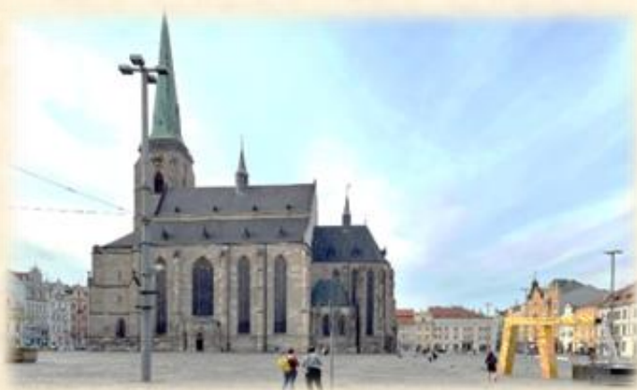
比爾森市中心廣場

捷克，站在斯拉夫文明與日耳曼文明的交會口，也曾經身為神聖羅馬帝國的心臟，是集結古典韻味於一身的精彩國度，包括了羅馬式、哥德式、文藝復興式和巴洛克式的文藝傑作。希望藉由半年的交換計劃，體驗捷克多元的歐式風情與文化。