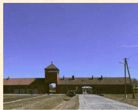
波蘭：歐洲最大的奧斯威辛集中營