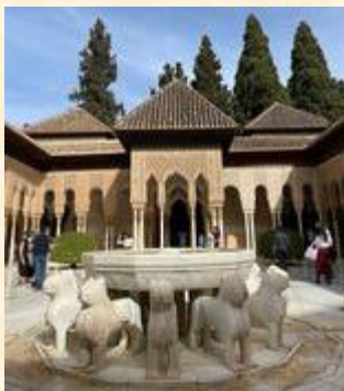
西班牙：中東風情的格拉那達