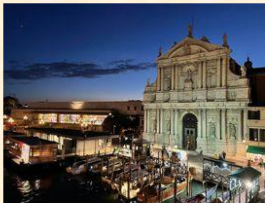
義大利：歷史悠久的水都威尼斯