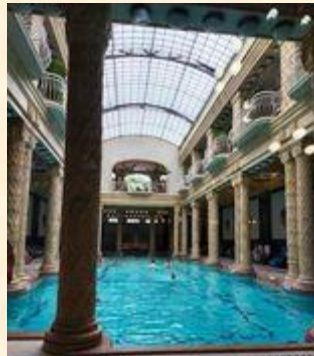
匈牙利：浴池都市布達佩斯