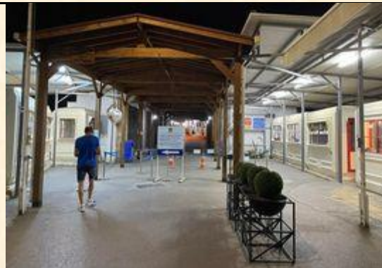
賽普勒斯：至今分治的首都尼克西亞