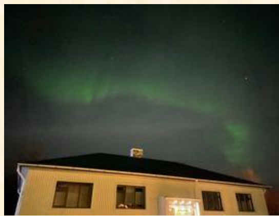
冰島：再冷都要出門追極光