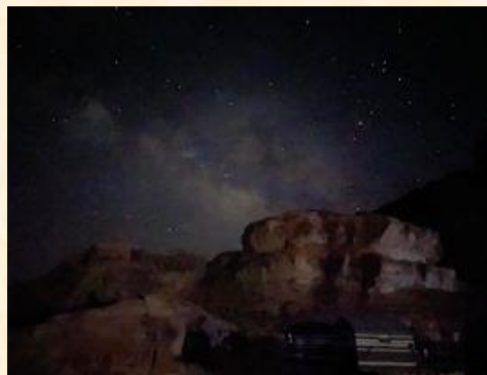
約旦：無光害星空的瓦地倫沙漠