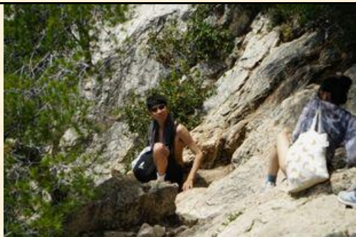
法國：好山好水的馬賽蔚藍海岸