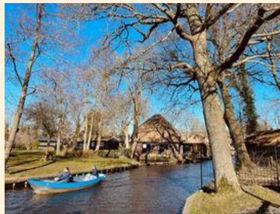
荷蘭：綠意盎然的羊角村