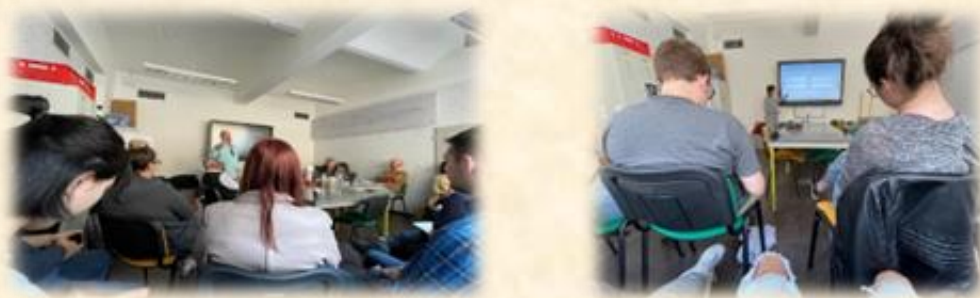
工作坊在學校的會議咖啡廳舉行，是個既專業又低壓的環境。