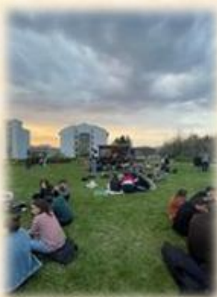
校園草坪的社團音樂表演