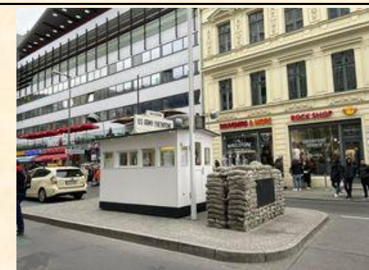
德國：柏林東西德之間的檢查哨站