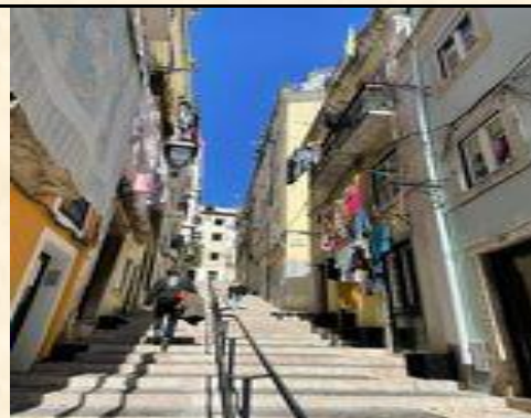
葡萄牙：地勢起伏極大的里斯本