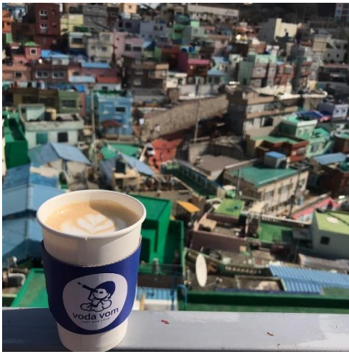
▲釜山 甘川洞文化村 (부산 감천동문화마을)