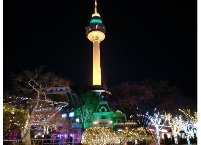
▲E-World、大邱 83 塔(이월드、대구 83 타워)