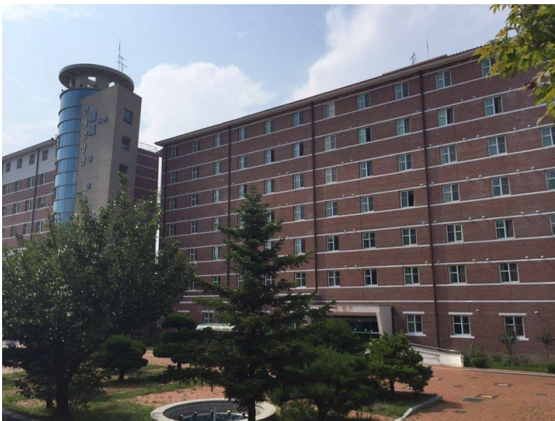
外國學生統一入住的宿舍 — 國際 1 號館(국제 1 호관)

大邱大學目前有 2 萬多名學生，設有 12 個學院、9 個研究院。近年來，大邱大學致力於國際化學習的推廣，大邱大學裡有將近 700 多名外國學生在語學堂(韓國語學堂)、本科和研究院學習，並且為方便外國學生的適應與生活，設有外國留學生專用的宿舍、多樣的獎學金制度與助學計劃學伴等等，在多方面給予適當的支援。