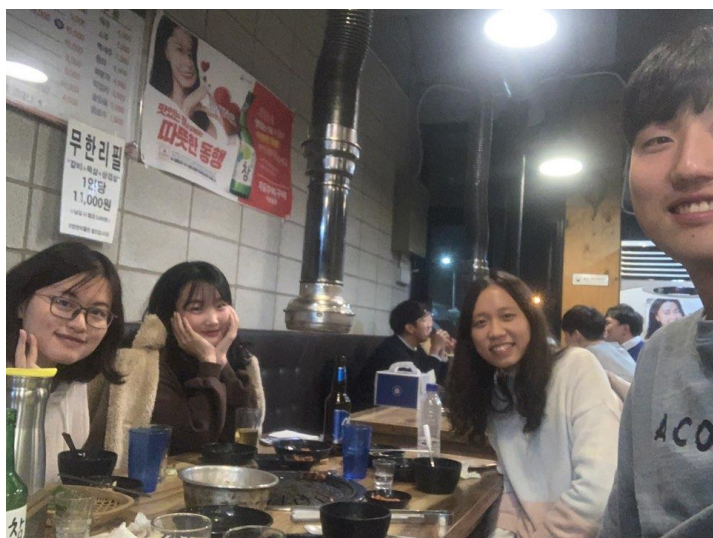
我和我的 Buddy 學伴們！

在長期的聊天交流下，對韓文的口說能力，真的有很大的幫助！我也因此到現在都還非常感謝我的學伴們，也希望彼此能一直持續著良好的友誼！