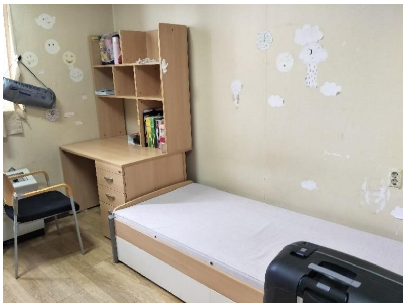
國際 1 號館(국제 1 호관) 宿舍房間(방)

房間的部分，宿舍裡大多都是兩人一間，每間附有室內衛浴，在 1 樓、4 樓分別設有廚房和飲水機，想自行料理的學生可以在時間內(每日晚上 10 點關閉)使用。而在 B1 的地下室附有學生食堂(학생식당)和洗衣機、烘衣機和熨斗，洗衣機和烘衣機每次使用需投入 500 元韓幣(約台幣 15 元)。宿舍的機能部分，不需過於擔心。