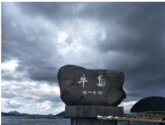
▲濟州島 牛島 (제주도 우도)