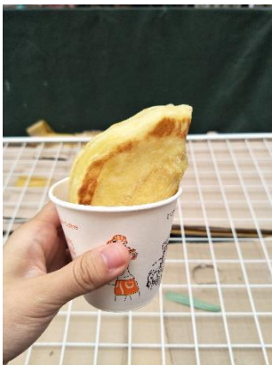
▲西門市場的糖餅 (서문시장 호떡)