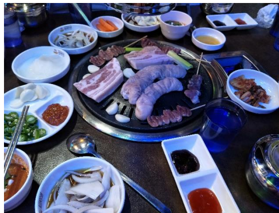
▲大邱有名的烤腸街--- 安吉郎烤腸一條街(안지랑골곱창)