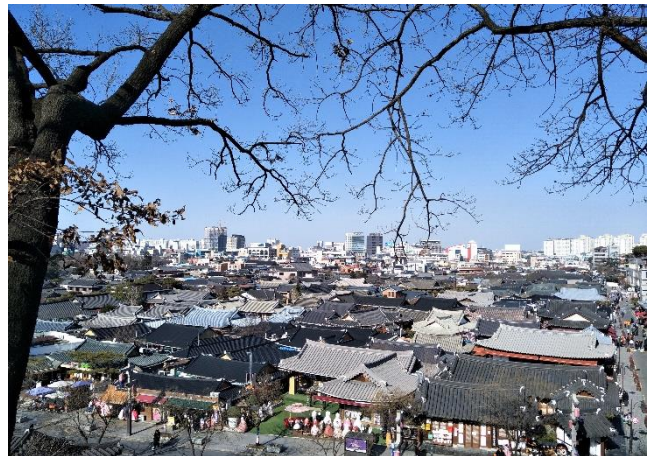
▲全州 梧木台 (전주 오목대)