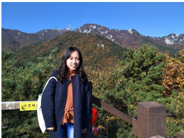
▲八公山(팔공산)的秋日楓葉季

除了韓國非常普遍的練歌房和咖啡廳以外，大邱也有很多風景優美的地方值得一遊！以下我以圖片的方式，簡單地介紹大邱的名勝景點：