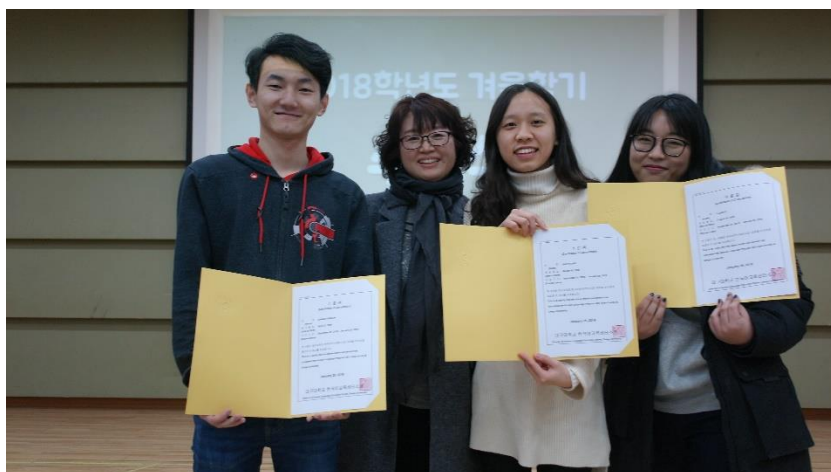
在結業式領到結業證書！ 和 2 級老師、同學們的合照

另外，語學堂在每期的課程中，都會安排一次文化體驗活動，如秋季時去榮州(영주)採蘋果、冬季時去安東河回村(안동하회마을)參訪等等……。