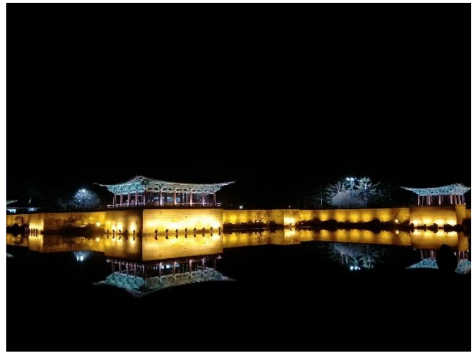
▲慶州 東宮月池夜景 (경주 동궁과월지)