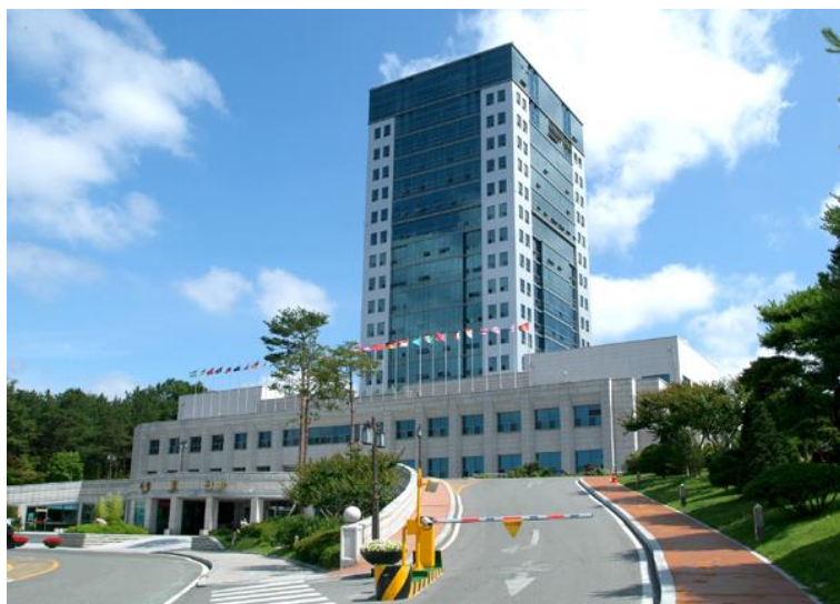
大邱大學的本館(보관) 這棟本館的二樓就有大邱銀行 (대구은행)

手機電信方面，基本上只要帶著近 1-2 年購買的智慧型手機，在使用上都不會有太大的問題。(我自己的手機是使用了 1 年半的 OPPO R9S)在大邱大的行動電話和網路，要到河陽的手機店辦理，因為我只有待半年，所以是採用預付卡的形式，每次存 20000 韓幣，供應電話和行動網路費用。(韓國的行動網路費有點貴，但韓國很多地方都有免費 Wifi，因此建議到哪裡可以先連免費 Wifi 試試看，這樣也能節省費用。而 20000 韓幣，我基本上都可以用 1.5 個月)另外，因為辦理手機電信，需要運用的韓文較為困難，因此建議有韓文基礎的同學一起陪同會比較順利。手機電信有許多方案，建議可以按照自己停留的時間做選擇。若是只待半年的同學，可以和我一樣使用預付卡的方案；而若是要待一年以上的同學，可以使用每個月的月租方案。