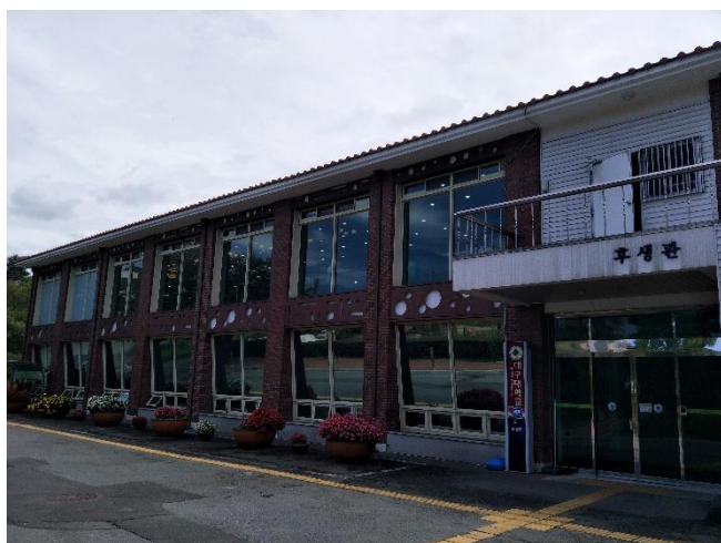
湖生館(후생관) 一樓設有健身房、自習室(독서실)、 便利商店(편의점) 二樓則是學生食堂(학생식당)

飲食方面，除了宿舍的 1 樓、4 樓附有微波爐和電磁爐，可以自行料理餐點之外，大邱大學裡也設有 5-6 個食堂(식당)，食堂餐點的價格大多落在 3500~5000 韓幣，比起市區內的餐廳來得優惠、便宜，各個食堂的特色也都不太一樣，有機會的話，可以多嚐嚐不同的食堂！