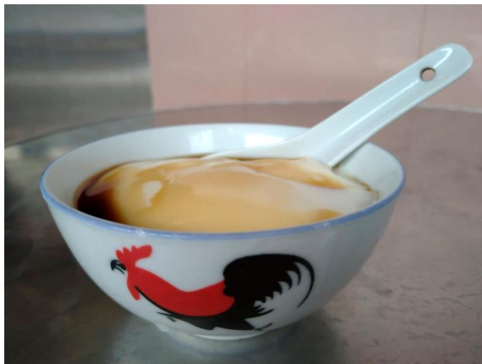
滑嫩無比的豆腐發