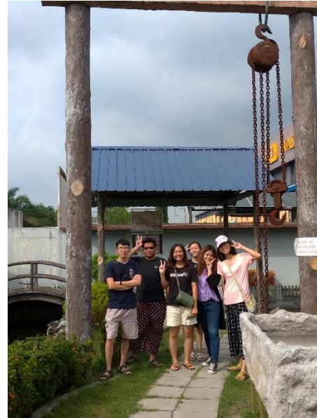
近打錫礦工業博物館