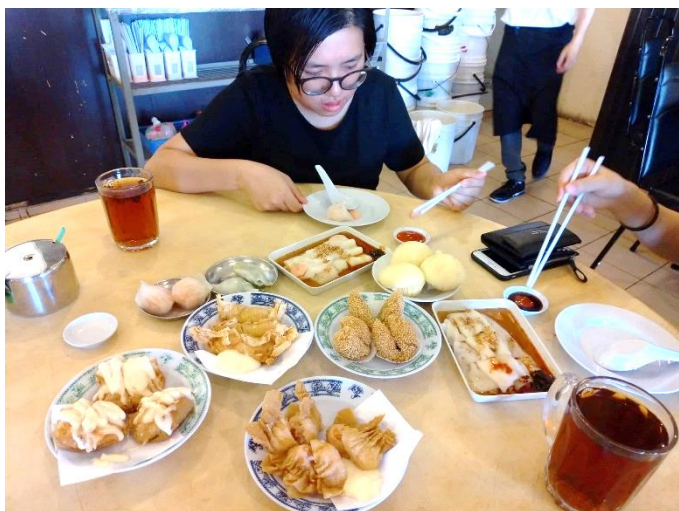
讓人食指大動的港式點心

到國外當交換學生是我從大一時就立下的目標，雖然我拖到大四上才去交換，而且為此必須延畢(因為沒有提前把主修修完)，但我很開心自己終究有實踐這個夢想，因為我這三個月在馬來西亞學到很多事情(規劃旅行)、品嚐到許多美食，做了許多以前不曾做過的事(住 Airbnb 享受露天游泳池、按摩、泡泥漿浴、穿泳衣赤腳走步道、爬樹、吃重口味的食物、玩拖曳傘、乘風破浪的搭船體驗、進入賭城、去環球影城、光大高樓繩索挑戰、穿伊斯蘭服裝入清真寺、到劇院看電影、和 Grab 司機聊天、夜間動物園探險、KTV 歡唱)，也多了許多探索自我的時光(到住家附近的花園散步、探討電影)，生活就如同馬來西亞給我的感覺——「多采多姿」！