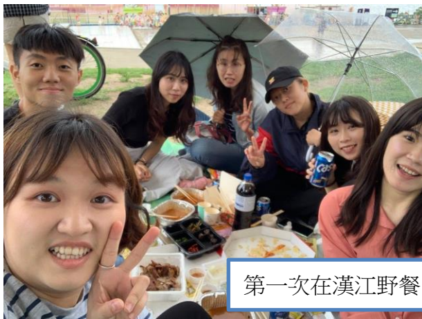
第一次在漢江野餐