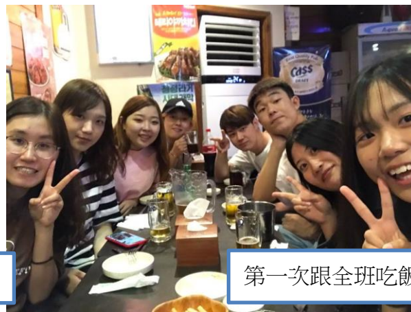
第一次跟全班吃飯