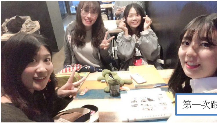
第一次跟同學一起讀韓文