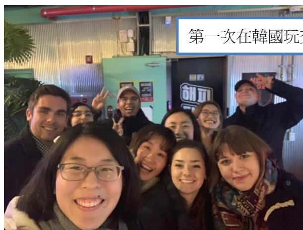
第一次在韓國玩交換禮物