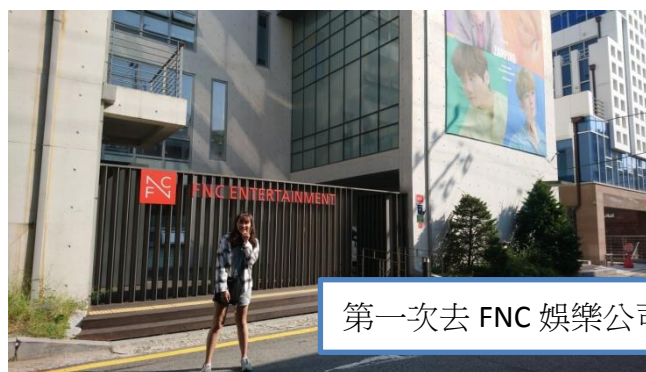
第一次去 FNC 娛樂公司門口