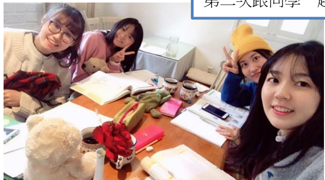
第二次跟同學一起讀韓文