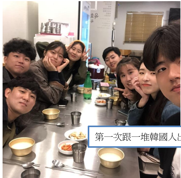
第一次跟一堆韓國人出去玩