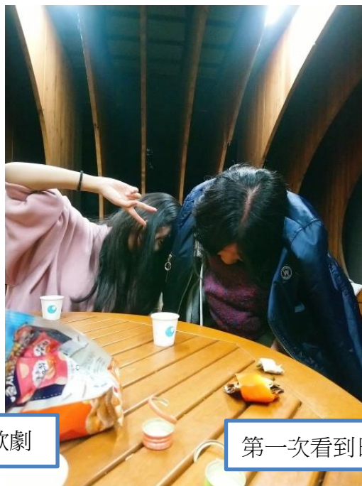
第一次看到日本人喝醉