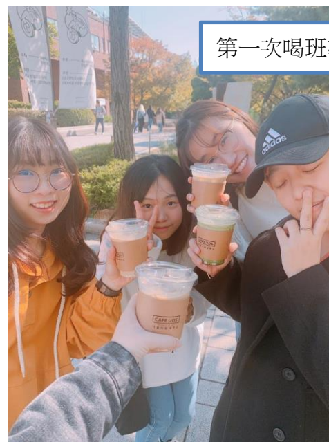
第一次喝班導請的咖啡