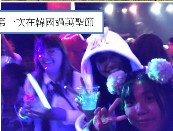
第一次在韓國過萬聖節