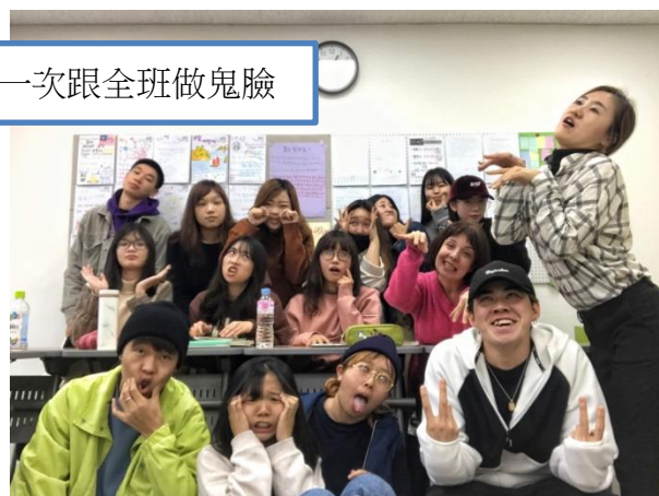
第一次跟全班做鬼臉