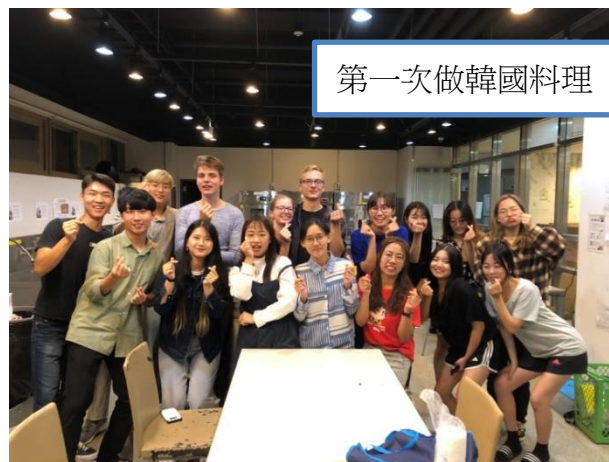
第一次做韓國料理