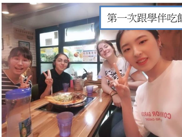
第一次跟學伴吃飯