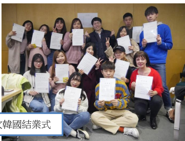
第一次韓國結業式