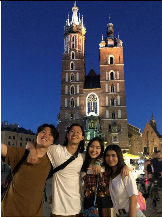
▲波蘭克拉科夫小鎮