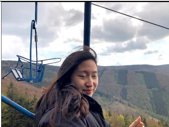
▲在捷克爬山、搭纜車，沿途風景非常美麗，見識到捷克的豐富的自然景觀