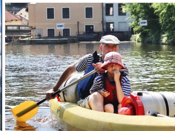
▲捷克 Cesky Krumlov