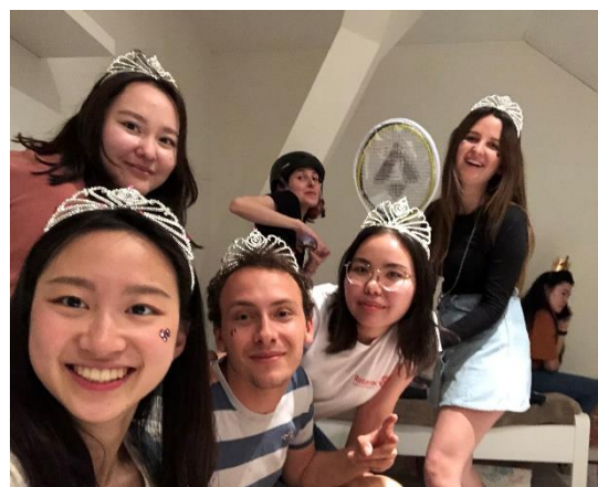
▲有些同學因為疫情關係要先回去，捷克的同學們邀請我們到他們家舉行歡送派對

在這半年旅遊了八個國家，捷克、德國、奧地利、波蘭、斯洛伐克、匈牙利、西班牙和葡萄牙。在旅遊中，跟不同的人去旅遊可以看到每個國家的人有不同的旅遊習慣。亞洲人習慣跑景點、拍美照，在旅程前會先將所有事情規劃好，路線、要吃什麼等等都會先茶好；而歐洲人習慣到一個地方靜下來走走，不一定要將每個景點都跑過，這樣不一樣的旅遊方式，讓我重新思考旅行的意義究竟是在時間內踏過每一個點，還是好好享受當下，讓旅行帶給自己心靈的平靜。