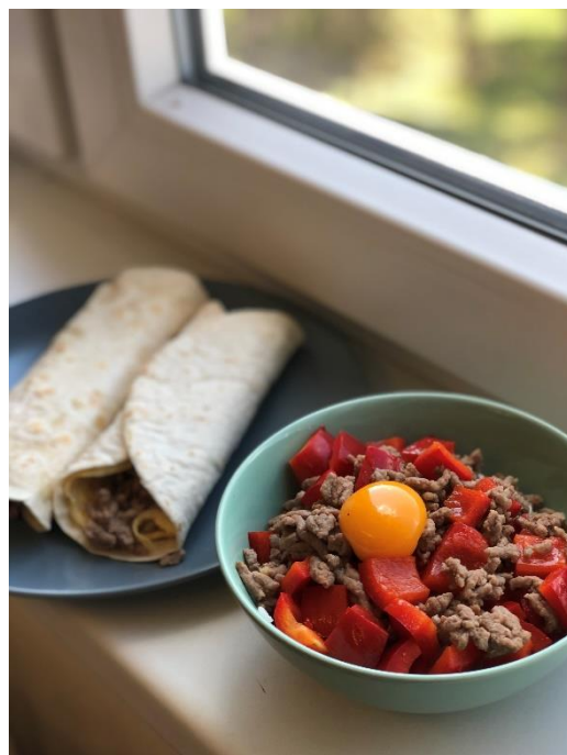
▲在台灣沒有下過廚，出國後第一次體驗下廚、自行買食材料理三餐

學校也會舉辦歡迎派對、紅綠燈派對…等各種派對，在派對上大家喝酒、聊天、跳舞，最重要的是認識新朋友，是一個機會可以讓自己表達自己、介紹自己的國家，原本不太會跟別人聊天的我，現在也開始會找話題與人交流，這其中參加派對幫助了我很多。