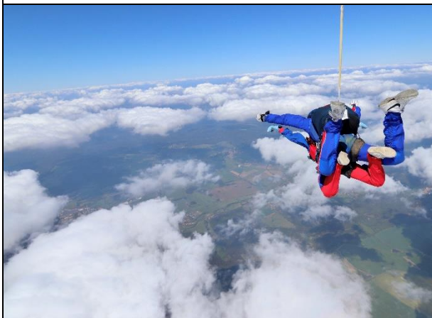
▲和台灣朋友去布拉格跳傘