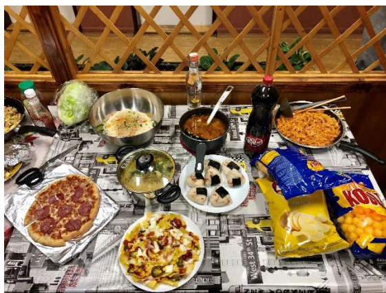
▲在晚餐派對中可以看到各樣的美食

在交換時，所有交換生／留學生都會住在同一個宿舍。由於一個人煮晚餐自己吃很無趣，於是我們會舉辦晚餐派對，就是所有參加的人帶一道菜，這樣就可以吃到各式各樣不同國家的菜色，也可以在晚餐時間聊天、彼此交流。墨西哥的朋友會介紹洋芋片配塔塔醬、韓國的朋友會製作深海炸彈（燒酒）、日本的朋友會介紹飯糰和大阪燒…當吃到不同國家的食物時，感覺自己身在一個大融爐裡，每種文化都可以被接受、被包容。