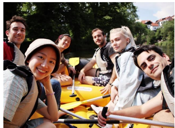
▲在 Cesky Krumlov 泛舟