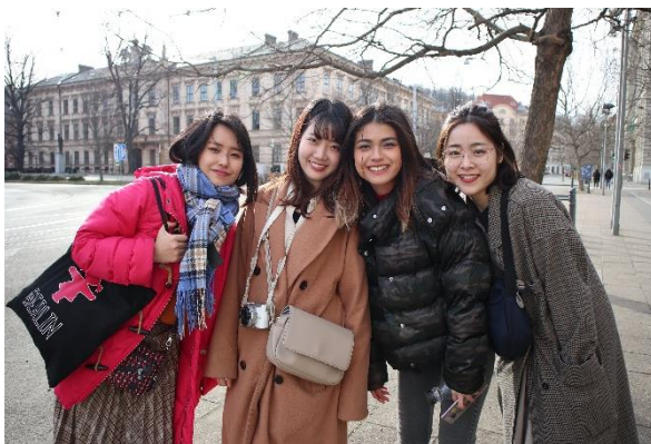
▲和朋友去捷克第二大城布爾諾旅行