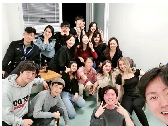
▲在參加派對之前，會 pre-drinking，大家會先喝酒聊天，再去派對