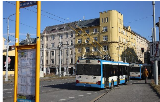
▲捷克到處都可以見到的路面電車（車子會連接電纜）