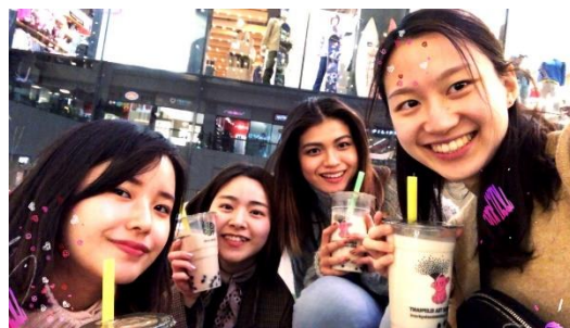
▲帶日本朋友去喝台灣的珍奶