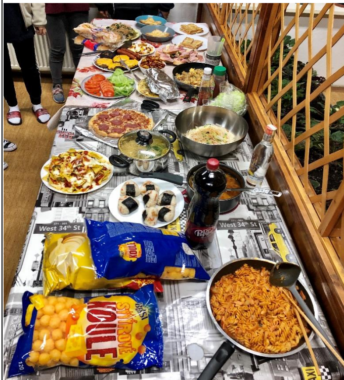
▲在宿舍一樓的交誼廳舉辦晚餐派對