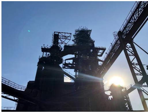
▲Ostrava 百年工廠，現已轉型為觀光用途