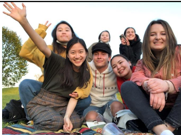
▲和外國朋友一起野餐、聊天