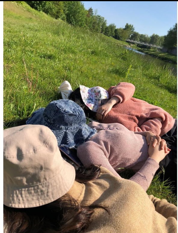
▲和朋友一起躺草地曬太陽