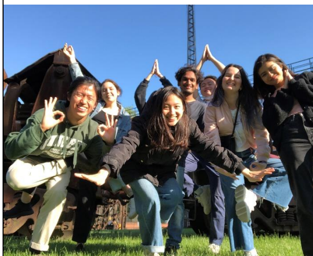
▲參觀奧斯特拉瓦百年工廠