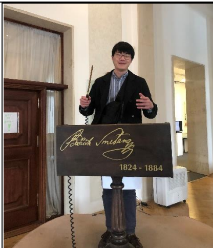
▼參觀捷克 布拉格史麥 塔納博物 館，館內演 奏許多知名 捷克樂曲