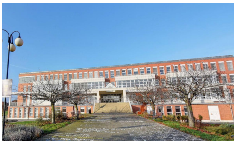
附圖為building A，是教育學院的院館

學校的院系包括教育、理學院、社會科學和文學院以及哲學院等。作為教育學院的交換生，我們可自由選修與教學、語言和藝術等相關的科目，選項多元。此外，不僅可以在所申請的院系內學習，還有機會參與其他院系的課程。