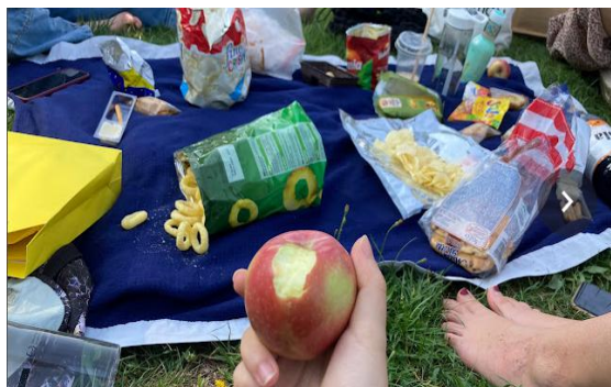
上圖為開學第一週舉辦的beach picnic

學校的ESN團體時常舉辦活動，協助各地的學生認識彼此。各種活動橫跨整個學期，不只舉辦在開學前幾週，且越往後期的活動內容越多元，會有如爬山、小鎮一日遊等活動。