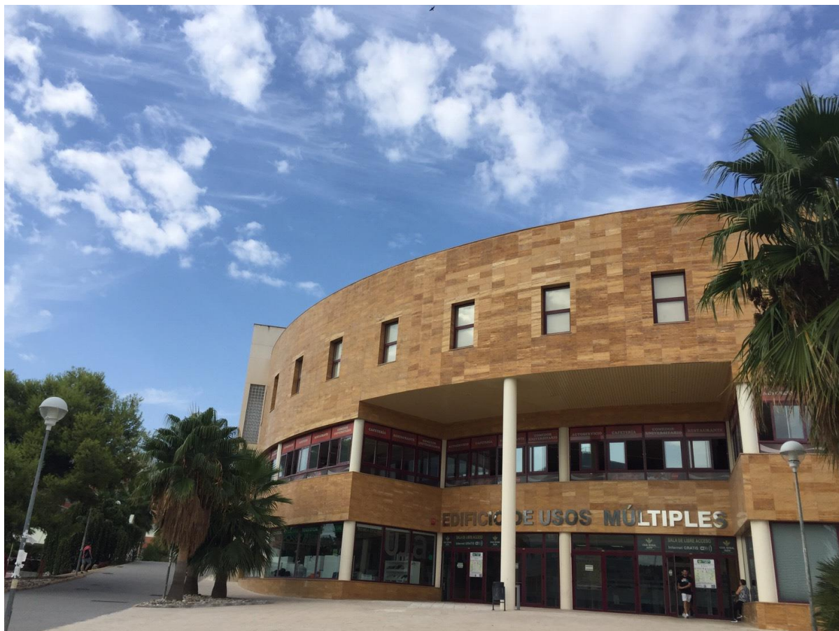
✧ 銀行跟學生餐廳都在這一棟

除了 buddy 外，每個交換生還有一位導師，所以選課問題都可以問導師，而且導師都會講英文，可以很清楚地跟導師溝通，哈恩大學選課很複雜，每個時間都有不同的東西要交或是申請。