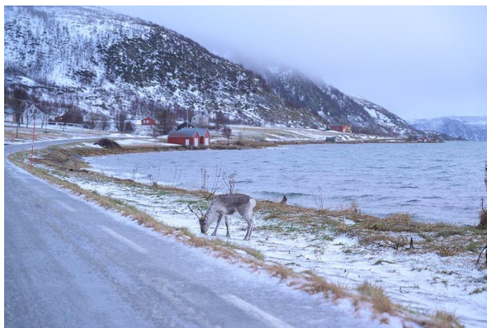
✧ 多虧這次交換，才讓我有機會到夢寐以求的挪威旅行