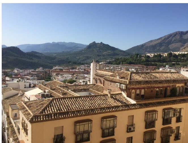
✧ （左圖）哈恩主座教堂