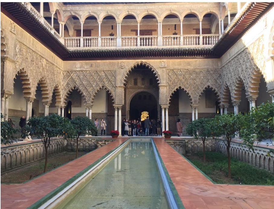
☆（圖左）Sevilla 王宮， 是阿拉伯融合基督教 風格的建築物

出國期間大力宣揚台灣，許多外國朋友都想到台灣觀光，而由於我對朋友很好，他們也間接覺得台灣是個好國家，有個韓國室友說的話最為動容，她說：「我原本對台灣沒任何興趣，但是跟你當室友後，台灣現在是我最想去的國家了！」返國後，如果國際處有需要我分享經驗給想申請交換的學弟妹，我也很願意，如果之後有講西文的人到學校參訪，我也很願意幫忙接待。