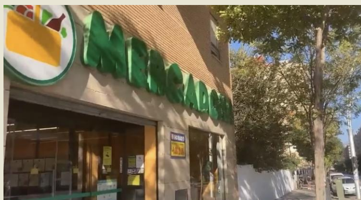
★ Mercadona 西班牙最大超市

周末時，如未和旅行社或自行出國旅遊，大多會提著電腦和書籍到能曬到大片陽光的咖啡廳坐下來悠閒地讀讀書、做作業。但西班牙每日的午休時間 Siesta 和周日全城休憩日使我們每週會需要在平日下課後去超市採買食物和日常用品。週日全城休憩又不想在家荒度一天時便會和三五好友拿著野餐墊和食物到哈恩最棒的公園——Bulevar Park 野餐。