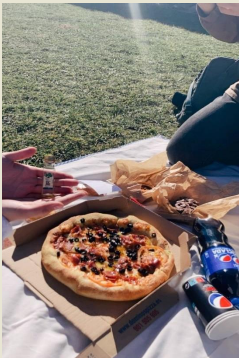
★ Bulevar Park