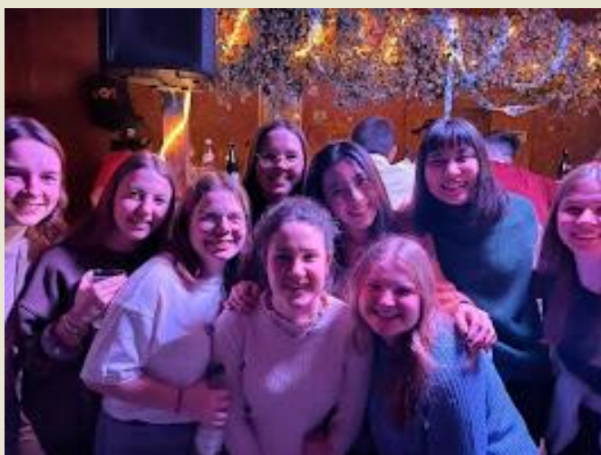
★在派對中也是認識朋友的好機會

西班牙的晚餐時間大約落在晚間 20:00 到 22:30，因此酒吧和夜店人潮幾乎需要過凌晨一點才會開始熱絡，也是在此時此地能將西班牙人熱情最大化。享受著音樂和身邊人們快樂的神情、熱情的舞步，伴隨著酒精也逐漸起舞，是我許多夜晚流連 Fiesta 的原因。