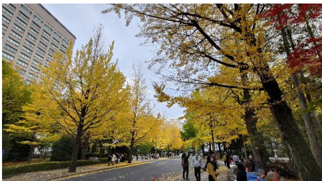
仙台市內秋季銀杏行道樹

而為了領略日文的奧妙，我研修了日本文學為主題的國際教養特定課題與文化與社會的探求。此兩門課選讀古典的源氏物語以及近代的三島由紀夫、村上春樹、吉本芭娜娜等作者所著之多種不同風格的文學作品，於課前閱讀後，在課堂上與同學進行討論，並且分組進行報告發表，討論和分組報告的過程中，對於所閱讀的文學作品也能更有深入的見解。