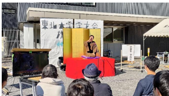
東北大學祭之落語社演出

我交換的期間正好碰到日本的學園祭期間，經過前幾年疫情期間的自肅，東北大學祭今年再度盛大舉辦，我也趁著這個機會去體驗了各個社團的成果發表。五花八門的社團中，其中最吸引我的是那些日本文化相關的社團，例如落語社、能樂社等，社員雖然是大學生，但演出卻不俗，在感受文化及交流時，同學的言談中充滿了熱忱，能感受到同學們的熱情滿溢。