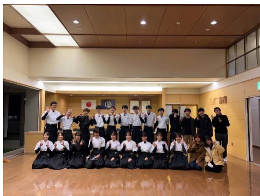
弓道社年末社團活動合影

除了充實的課內活動，社團活動部分我參加了東北大學的弓道社，定期與社員在仙台市內的青葉體育館進行弓道的練習，雖然由於交換時間有限，我沒有辦法學習到能實際上場的程度，但盡可能地學習弓道射禮文化與和弓的使用，對我來我仍是很大的收穫。除了練習外，社團也會舉行例如日本東北地區秋天慣例的芋煮會，社員們一起在河邊煮食交流，以及弓道年末的納射會等活動。