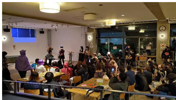
國際宿舍之萬聖節交流活動

東北大學的學期授課期間結束後，學校仍會有許多學術活動。例如我參加了經濟系舉辦之邀請校外教授的研討會，會中受邀教授針對他們的專業領域進行發表，並與在座的老師同學們討論相關議題，能夠聽到教授們互相提出意見進行討論，難得的機會讓我收穫良多。