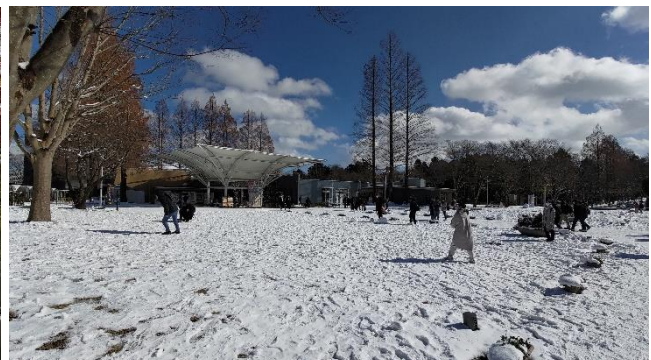
川內校區之冬季景色