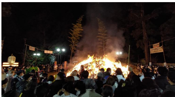
大崎八幡宮之松焚祭