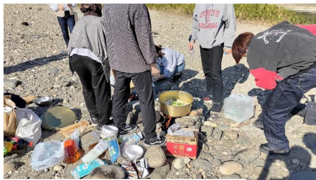
東北地區秋季活動之芋煮會

交換生們偶爾也會一起相約出門，對我來說是很特別的經驗，例如在棒球賽季季末時，與歐洲的交換生們一起去樂天生命球場看棒球比賽，在此次活動中我扮演著其他交換生與球場人員的英日語交流橋樑，並且在他們有需要時介紹球場文化和棒球的規則等，是一次有趣的英語會話活用體驗。而由於疫情的影響，國際生宿舍舉辦的相關活動減少不少，但還是有些有趣的活動，例如聖誕節時舉辦國際生宿舍的萬聖節、聖誕節交流晚會等。