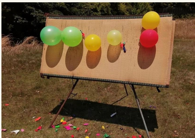
洋弓部氣球標靶 （一開始用氣球練習）