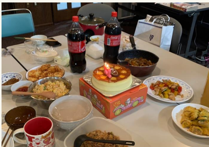
便當交換會&慶生派對 （每月至少一次）