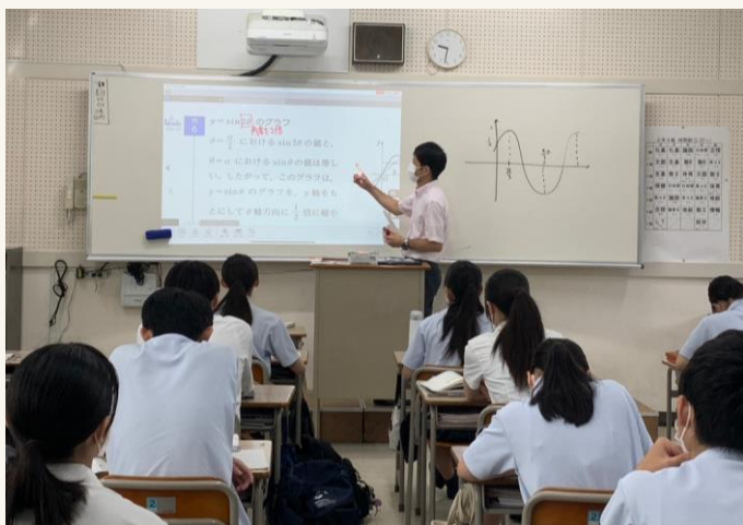
愛教大附屬高校的一日 參訪／觀課活動 （此圖為數學課照片）

在留學生宿舍裡，宿舍負責人或交換生同儕們時常發起各式各樣的活動，例如：歡迎派對、一起製作餐點、便當交換派對等。而校方的國際交流中心則時常提供各式活動資訊，並詢問我們是否有參加的意願，例如：試穿浴衣、至日本家庭過一天、與當地居民一起下田收穫蔬果、製作與擺放女兒節娃娃等，非常豐富有趣。