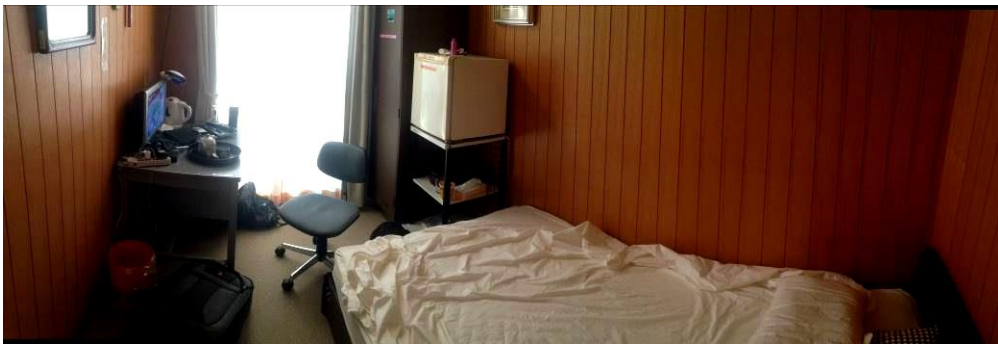
[圖 3，這是我在 2 樓的房間，有電視冰箱甚至連茶具都有，住起來十分 舒適不輸外面旅館喔]