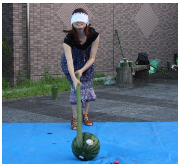
[圖 10、圖 11，玩蒙眼打西瓜後來吃個大阪燒和彩色刨冰吧]