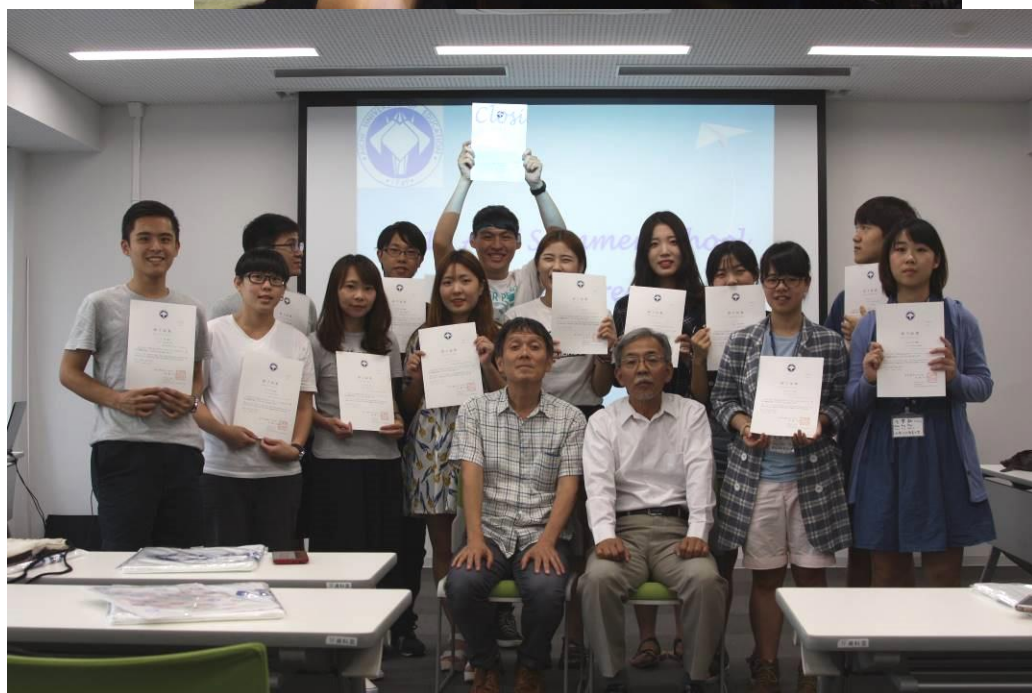
[圖 25，閉幕式領取修業證書，為這次交流畫上暫時的句號]