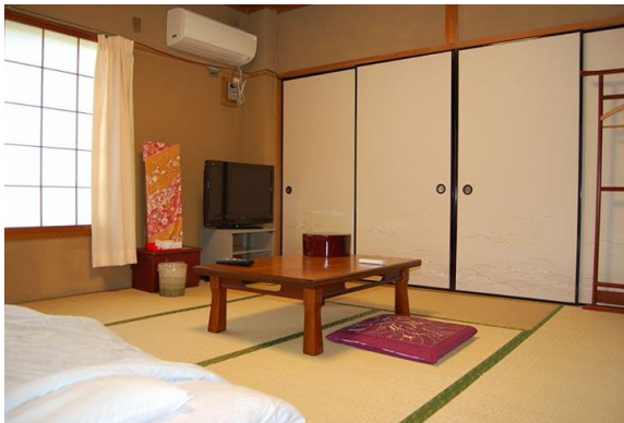
[圖 4，女生們所這個 4 人一間的和式房]