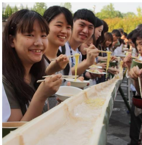
[圖 9，流水素麵，當夾住那滑溜的麵線時，大家都露出成就達成的笑容]