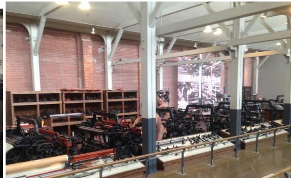
[圖 20、圖 20-1、圖 20-2，TOYOTA 紀念博物館，這裡有從創始開始的古董機械到先進油電混和車都有可以實際操作體驗喔]