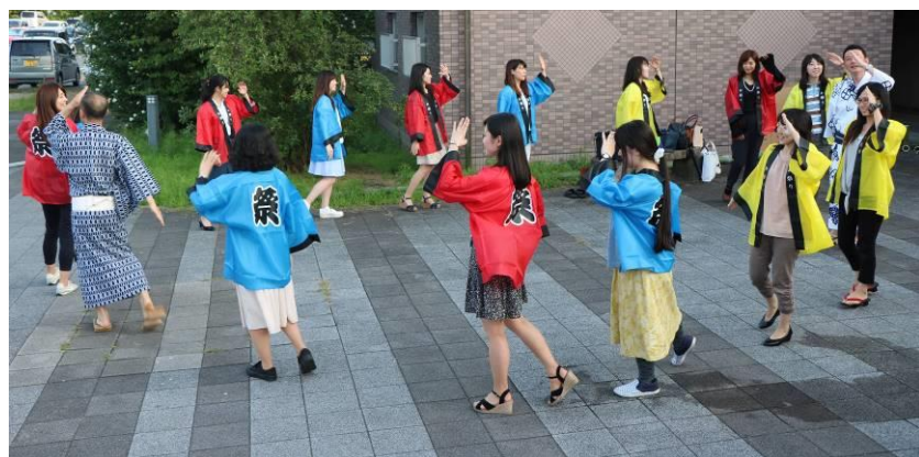
[圖 8，國際交流處的老師們示範盂蘭盆舞]