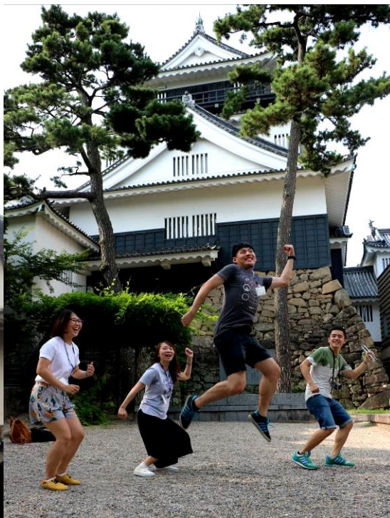
[圖 15、圖 16，名古屋的兩大名城，名古屋城及岡崎城，因為二戰時被美軍炸毀，現在我們所見到的為後來日本重建還原之城堡]