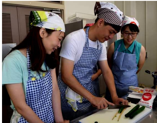
[圖 5，日本料理實作課，製 作小黃瓜雕龍來訓練我們刀工]