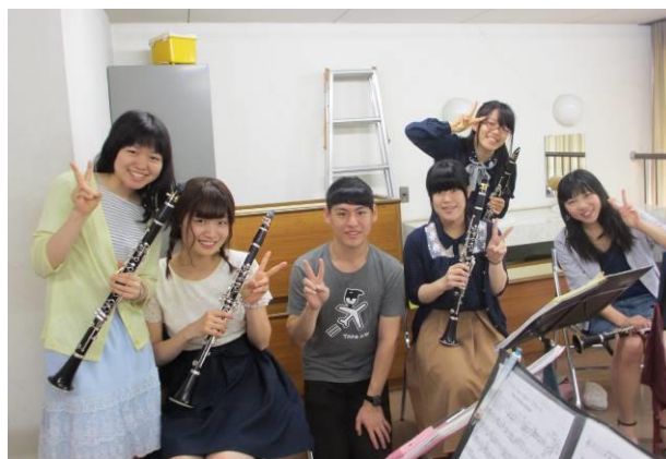
[圖 22、圖 23，大學招生開放參觀日，有非常多的高中生來體驗大學生活，我也趁機混入愛教大的吹奏樂部當一日換社員]