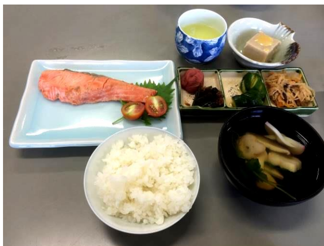
[圖 6、圖 7，組員們經過與食材們的一場激戰之後，終於完成了我們的鮭魚定食。別看那配菜很不起眼，樣樣都非常費工夫從 0 做起喔，體會到煮飯的辛苦，いただきます～]