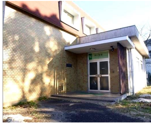
[圖 2，專給外國訪客使用之宿舍 「井ヶ谷荘」，共可住 14 人]