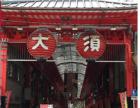
[圖 13、圖 13-1、圖 14，大須商店街及大須觀音寺，就像逛西門町一樣可以撿到很多便宜又有趣的東西，除了購物之餘，參拜觀音寺和在廣場餵鴿子吃豆豆也是很熱們的活動喔!]