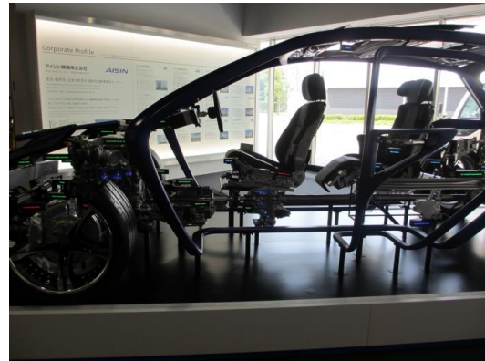
[圖 19、圖 19-1，參觀未來生活館，這裡有很多可以互動的設施，很多都利用現在很夯的物聯網和人工智慧去作出能使生活更便利更自動化的家電和載具]