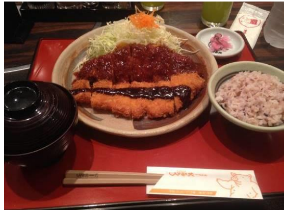
[圖 17、圖 18，參觀傳統紅味噌工廠，古法以大木桶巨石醃製，是名古屋限定的特產，紅味噌吃起來有種濃醇又回甘的口感，搭配上炸豬排可以說是絕配!]