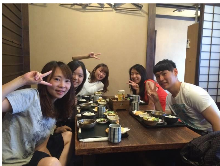
[圖 24，傳統日本烏龍麵定食體驗，每一樣配菜都小巧可愛，在和室正坐吃飯腿超麻的]