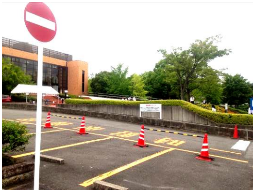
[圖 1，被森林包圍的校園一景]