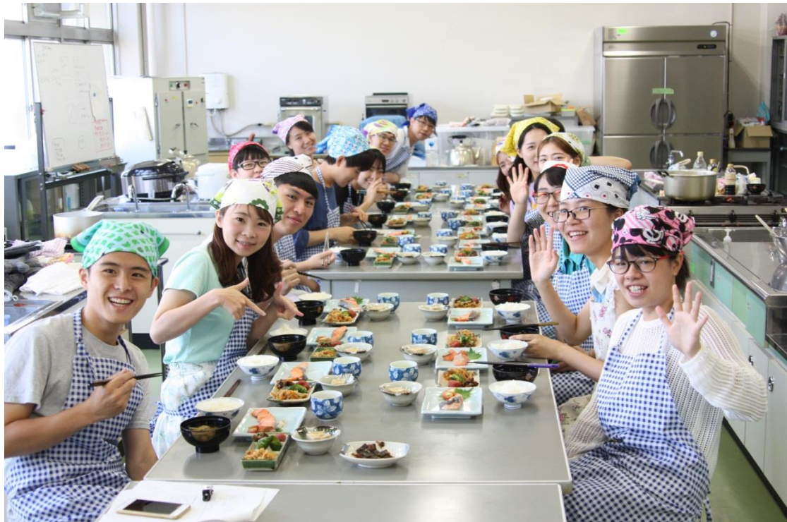
第一堂課，大家一起動手做日式料理。一起完成的料理吃起來超美味！！

陪我們一起上課，其中，最讓我感到印象深刻的是，晚上的時候我們會到留學生宿舍和他們一起玩團康遊戲，從遊戲當中我發現留學生們的感情非常好，雖然大家可能都來自不同的國家。對我們也非常熱情大方，跟他們互動關係同時交換了很多經驗和有趣的事情。非常的幸運有這一次的經驗，除了可以和留學生和日本學生之間到了很多新的詞語，最重要的是體驗的在日本當地的生活，和親自接觸他們的傳統文化。