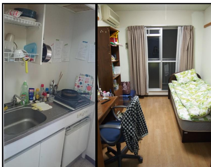
↑ 溫馨的m y 窩