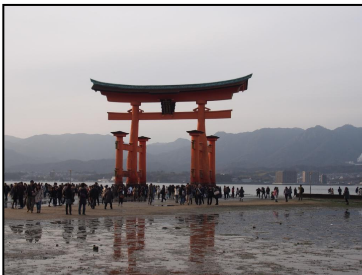
↑ 世界遺產・嚴島神社 海中的鳥居