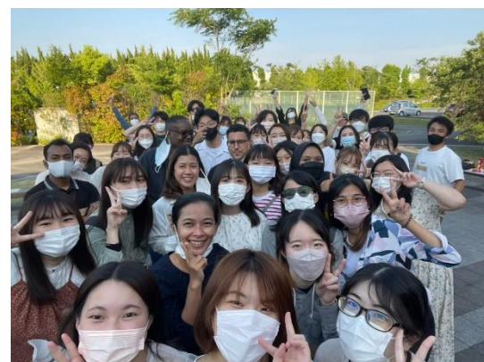
↑ KFA 的活動 ↓