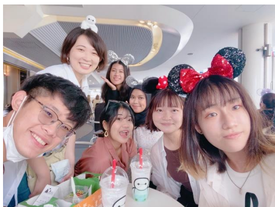
↑ 迪士尼 ↓