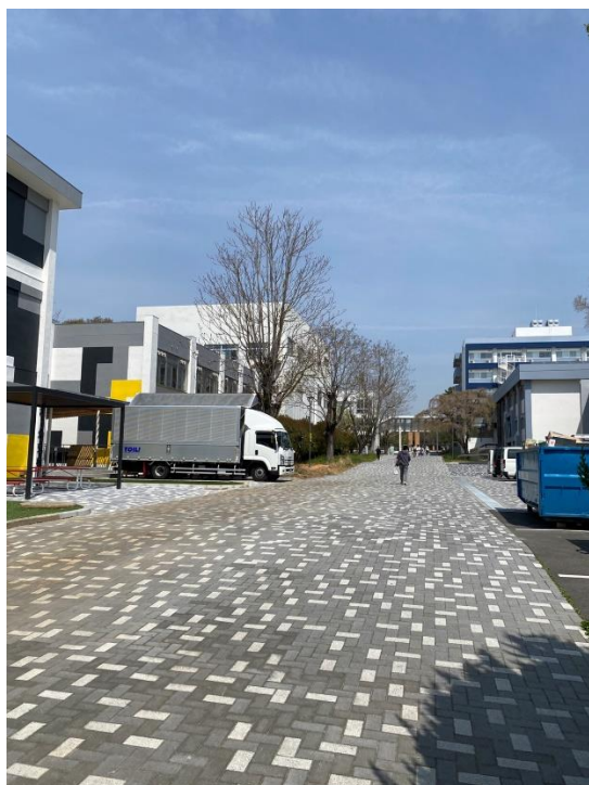
↑ 宿舍往校園內的路