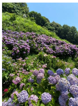
↑ 跟彰師一同交換的人及印尼交換生們去看繡球花 ↑