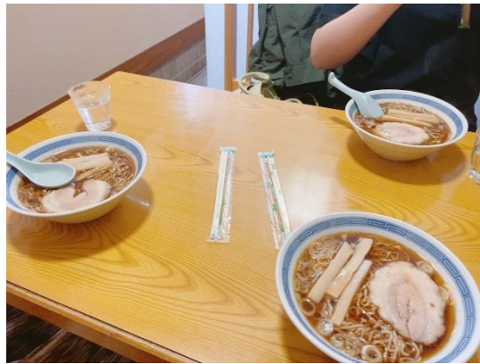
↑ 《君の名は。》的男主吃的高山拉麵

由於是在國外，基本上想做什麼都不會被限制也沒有人管。想出去玩就出去玩，也可以讀書、逛街等做很多事情。只要有長假的話我都會出去玩。在黃金週時，我和彰師、台師一起交換來的人及韓國交換生們一起去了大阪、USJ、京都、宇治、三島、鎌倉、熱海、東京這些地方。也有一次的假日我們去了高山飛驒，算是《君の名は。》的聖地巡禮，順便吃吃看飛驒牛。有個連假我們也去了三重縣玩三天兩夜，看了很多很漂亮的景色，非常有趣。7月時，我們跟住在宿舍的大家一起去迪士尼。在短短5個月內，我們去了很多如果是短期自助旅遊的人不會去的地方，真的是收穫滿滿。