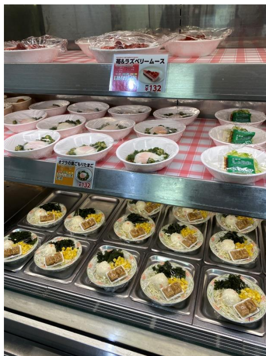
↑ 食堂内点餐 ↓