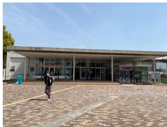
↑ 第一福利施設（第一福利社）