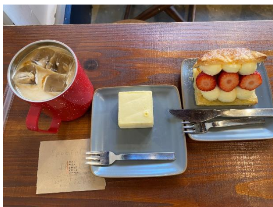
↑ 自己逛街時發現的咖啡廳

除了跑遠門外，也常常去附近的地方當天來回。像是名古屋市、岡崎市等，有很多很有趣的店家或逛街的地方需要自己去探索。也因為太常跑出去玩，導致回程時行李箱塞不下，一定得丟掉一些從台灣帶來的東西。