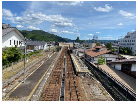
↑ 電影場景 ↑