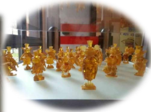
琥珀做成的西洋棋組&樂隊