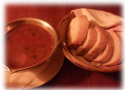
匈牙利傳統料理古拉許(Goulash)