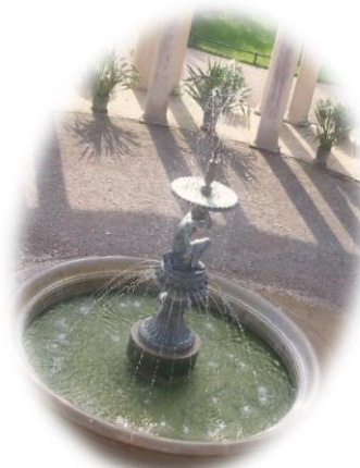
有北方新天鵝堡的美稱