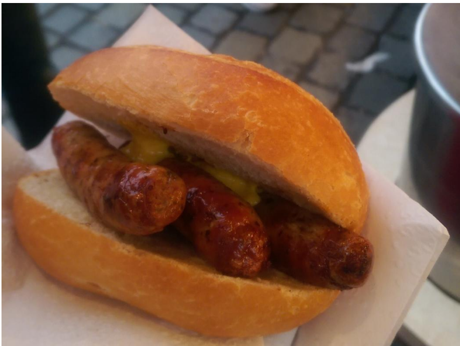
德國紐倫堡式的德國香腸麵包(Bradwurst)

由於德國為歐洲中心，去歐洲的其他國家相對便宜，本人也去了德國附近的幾個國家旅遊，包含到挪威找聖誕老人、丹麥哥本哈根騎腳踏車觀看景點、法國巴黎感受文藝氣息、匈牙利布達佩斯享受世界第一夜景、義大利水都威尼斯參加面具節及到隨處可見遺跡的羅馬，本人發現其實旅行的意義除了感受不同地方的風俗民情，還有一項很重要的是”人”，在旅行中或學校曾遇到許多人許多事，以往許多想法都已被禁錮在既有的觀念裡，藉由與不同國家不同種族的人交流，可以得到很多不同的觀念，擴展自己的視野與想法。