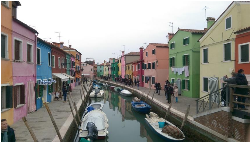
義大利威尼斯彩色島