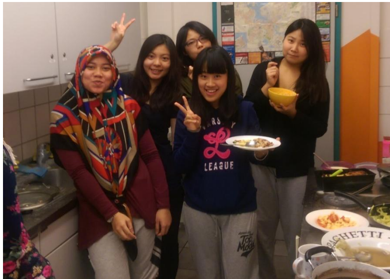
與馬來西亞同學一同在宿舍廚房煮飯

住在學生服務中心(Studentenwerk)的宿舍，在入住時會先於學校付一筆網路、設備等的費用，廚房與廁所為共用，一個月租金依房型不同大約為 190 歐到 230 歐之間。