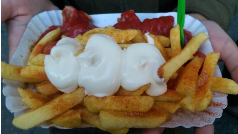
德國人非常喜愛的德國咖哩腸+薯條(Currywurst+pommes)