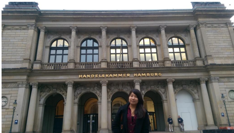
到德國漢堡與世界最古老證交所合影

學校也辦理了許多項活動可供學生參加，例如打保齡球、在宿舍附近的 PUB(Mensakeller)所舉辦的萬聖節舞會、電影之夜、一同坐巴士到其他鄰近城市旅遊、聖誕節的聖誕晚會等，非常豐富多元，可以讓各國學生互相認識！