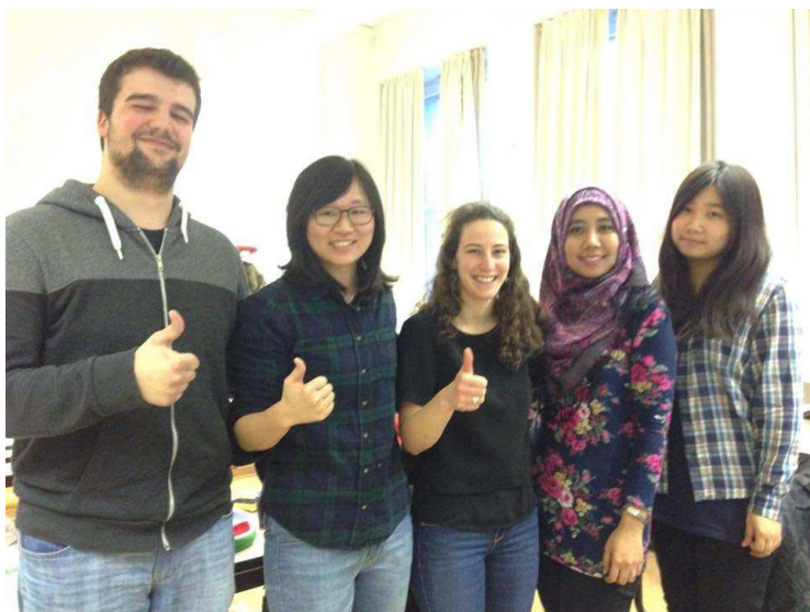
與課程” Culture and diversity at work” 組員合影

在開學剛開始，國際事務處會舉行一場介紹會，所有交換生皆可參加，此活動有學校介紹、交換生自我介紹、選課問題等，選課非常簡單，只須於上課時間到達教室上課，期末時再將所上科目遞交給國際事務處小姐即可，不須事先進行任何選課動作。