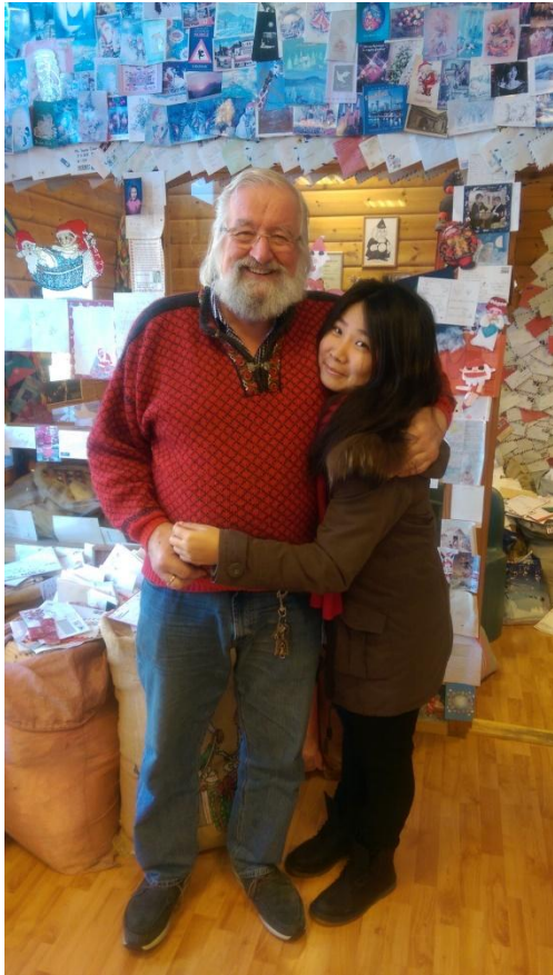
到挪威與工作滿檔的聖誕老人合影