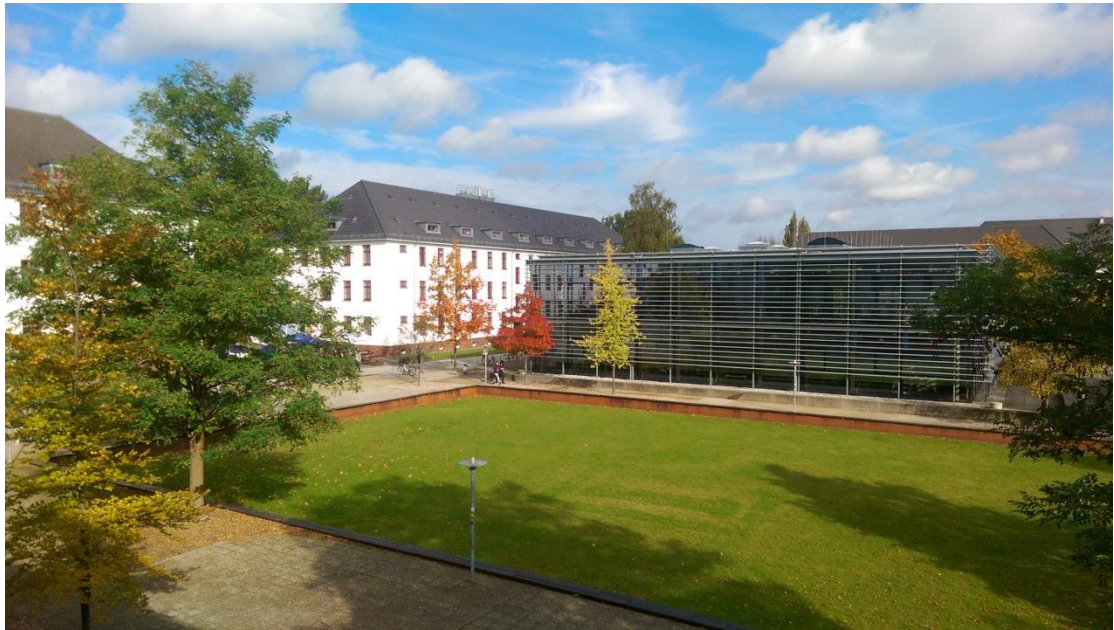
學校秋天美麗的景色

感謝這一次有機會到德國參與交換生計畫，也因為有學海飛颺的獎學金，讓本人此趟的負擔少了一些，能夠更盡情享受在異國學習的生活，從此趟學習，本人不僅有更開闊的視野與想法，還讓本來較不善於表達的我，變的能夠主動多與人溝通，更是學習到外國學生踴躍的回答發言的上課方式，也感謝這一路上遇到的所有好心人，因為有他們的幫助，我此趟學習才能如此平安順利。