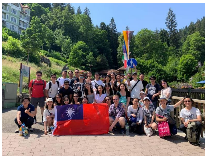
(參加司徒加特同學會舉辦的黑森林三天兩夜團)