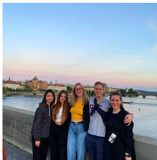
(與來自歐盟各國的交換生去捷克布拉格)