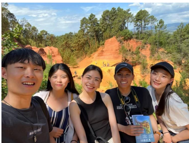
(與在歐洲各國交換的台灣人前往南法自駕)