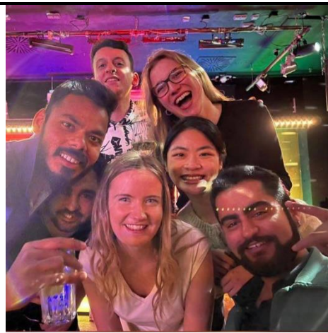
(交換生朋友替我慶生)