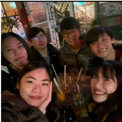
(與在歐洲各國交換的台灣人前往布達佩斯)