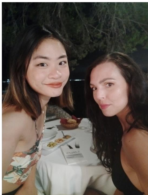
(受交換朋友邀約至她家作客)