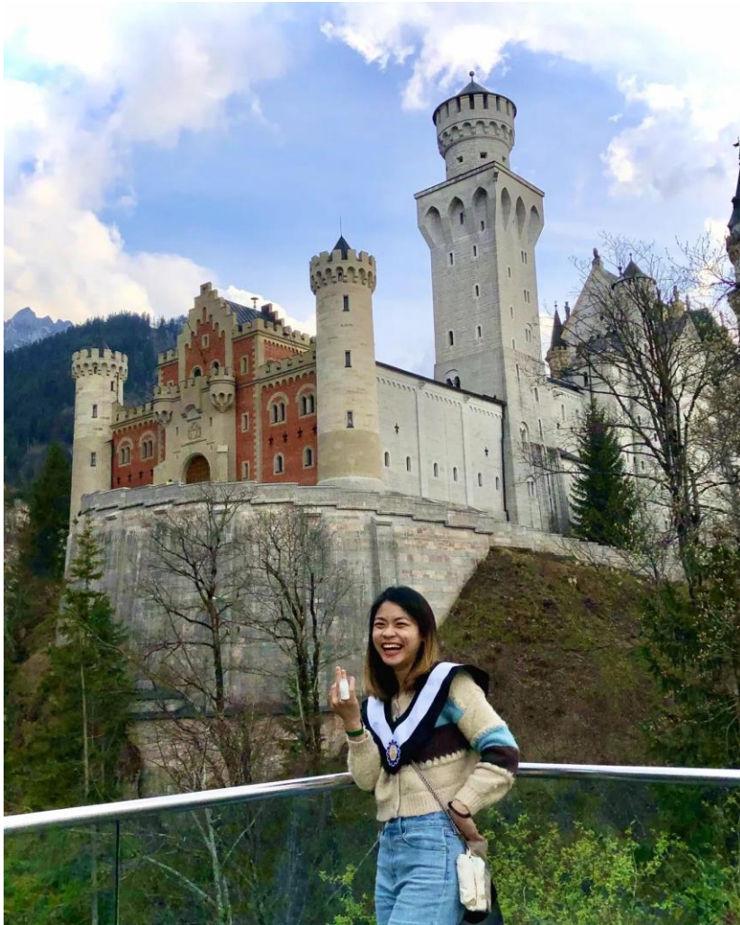
（此為與受傷手指頭於德國新天鵝堡前的合影，雖然不幸受了傷並縫四針，最終還是選擇了開朗的面對無法扭轉的事實）

離宿舍開車五分鐘的醫院急診室。我割傷了，在不確定傷勢嚴不嚴重的情況下德國當地朋友替我叫了救護車，結過換來一頓罵，醫護人員認為我們浪費社會資源，但手上傷口血流不止的我從未經歷過這樣的事，嚇得不知該如何是好，慶幸的是醫護人員口中雖然唸了我們一頓，但還是細心仔細的替我重新包紮，並不斷的安慰我，爾後便送我至醫院並告知護理師事發狀況。慶幸的是，學生保險於出事前四天即正式啟用，不然我得現場繳納 200 歐的急診費。不幸的是，正當我以為只需一兩個小時的等候時間即可接受醫生的診治，將皮開肉綻的手指縫合，卻換來六小時的漫長等待，即便等到醫師將傷口縫合，我仍需等待 40 分鐘才等到他"同事"前來替我將血淋淋的手清理乾淨與包紮。從受傷的那一刻，我等待了整整七至八小時才完成了整個療程，離開醫院時已身心俱疲，只想趕緊回到溫暖的宿舍。獨自一人捧著受傷的手在醫院急診室等待真的很不好受，即便感到崩潰，我仍需打起精神鼓勵自己振作，這就是在國外的現實，即便是傷患，沒有人有義務要第一個處理你的傷勢，也沒有人有義務要照顧你的心情。在國內，身體稍有狀況，父母就會立即前往關心，協助辦理手續與提供協助，但在國外，時時刻刻必須依靠自己，須學會如何處理各種問題，心情方面也要學會自我調適，避免沉溺於悲傷情緒中進而影響身心靈健康。