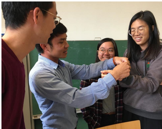
圖表 7 寮國同學分享當地文化-手環