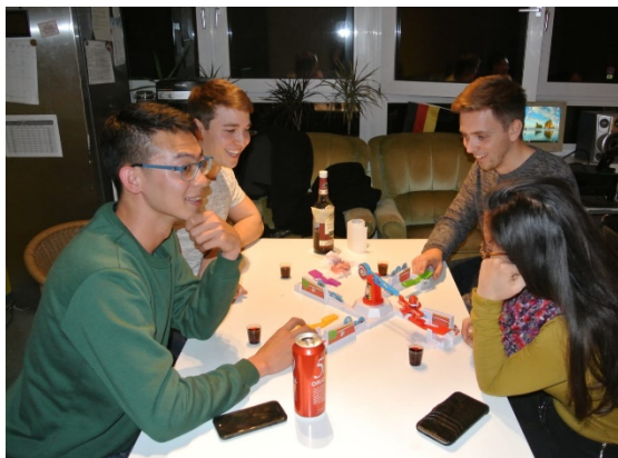
圖表 5 德國人的生日派對