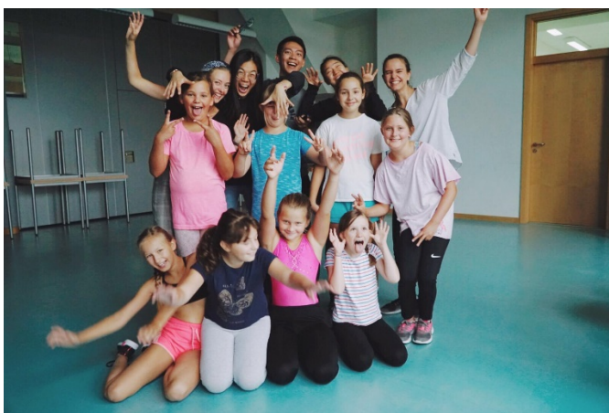
圖表 4 Square dance 方塊舞