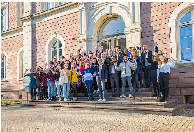
圖表 2 全體交換生合影