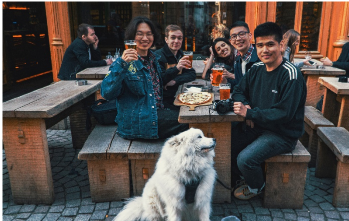
圖表 8 與同學一起到法國旅遊