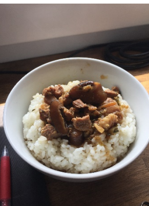
圖表 6 自製滷肉飯