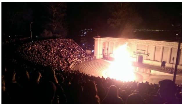
和死對頭 stanford 比賽前一晚的 bon fire rally(信心喊話)