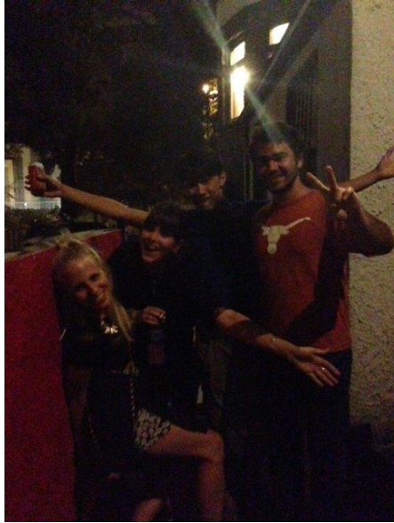
假日的休閒社交活動就是去參加派對