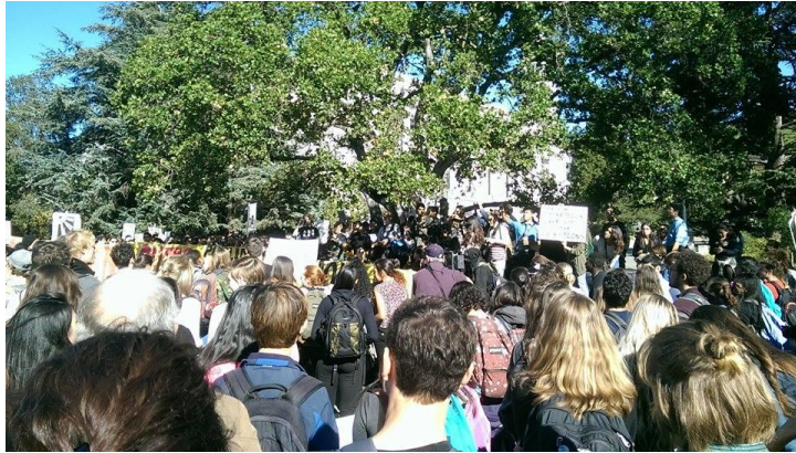
被稱為美國社會運動孕育地的柏克萊學生正在抗議學費調漲