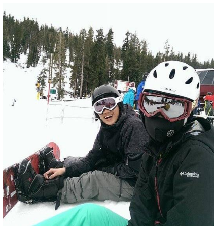
馬克吐溫曾說「如果想要和天使呼吸一樣的空氣，那就到 tahoe」的北加州渡假勝地 lake tahoe(夏天避暑冬天滑雪)