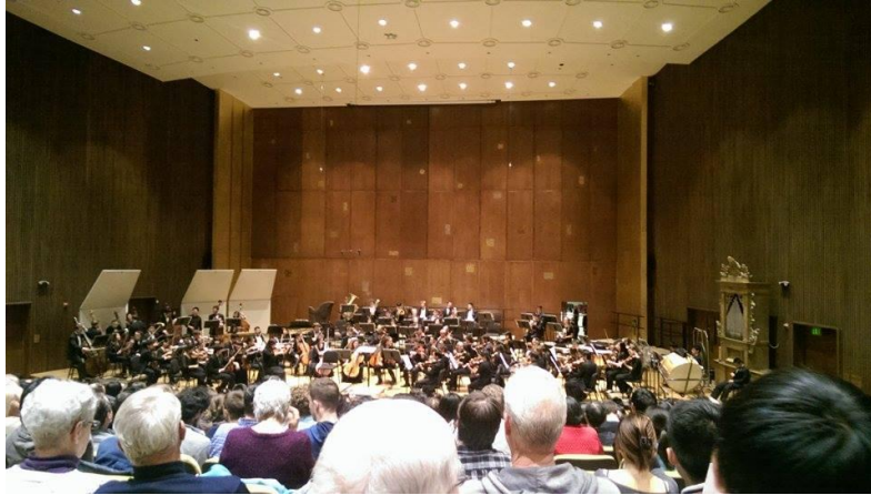
柏克萊的交響樂團