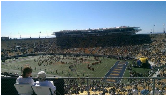
柏克萊的美式足球比賽