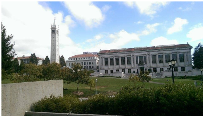
Doe 圖書館和 campnile(塔)

接受世界級的大學教育是我申請的第一個目的。加州大學柏克萊分校是全世界最好的公立大學，全球排名第三(全美排名第二?)。undergraduate 和 graduate school 加起來有超過 35000 名學生，李遠哲、宋楚瑜、王雪紅都是這裡的校友(郭台銘的兒子和馬雲的兒子都在這裡讀書)。曾經是台灣人的留美首選，從網路書店還有街頭巷尾一堆以柏克萊命名的補習班或診所之類的就可以看出柏克萊在台灣人心中的地位。在柏克萊我期待不僅能受到最好的大學教育，也能認識許多最優秀的學生。了解「傳說中」的美國大學是我的第二目的。暢所欲言的自由講堂、豐富的派對、對大學運動與精神的瘋狂等等。我想知道在世界的另外一頭，另一個世界的大學生到底都在做些甚麼。柏克萊的地理位置也增加了我這趟行程的興趣，與柏克萊隔著舊金山灣對望的舊金山是一座歷史悠久的城市，因淘金潮迅速發展的舊金山除了有世界最大的中國城，以歷史悠久的嬉皮文化為根基的它展現多元且豐富文化的同時也保持著對各式人權的尊重(算是一個很前衛的地區)。它也是 GAP、Levis 和 twitter 總部所在的城市！附近的矽谷在這幾年又可以說是世界科技的中心，因此說舊金山灣區一帶是世界最偉大的地區之一絕對不過分。