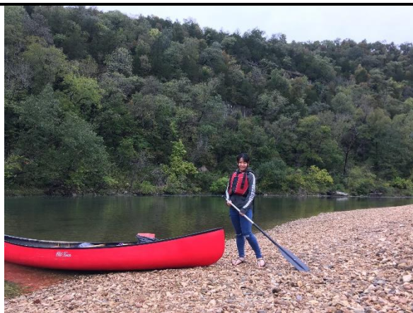
參加健身中心舉辦的四天三日獨木舟旅行