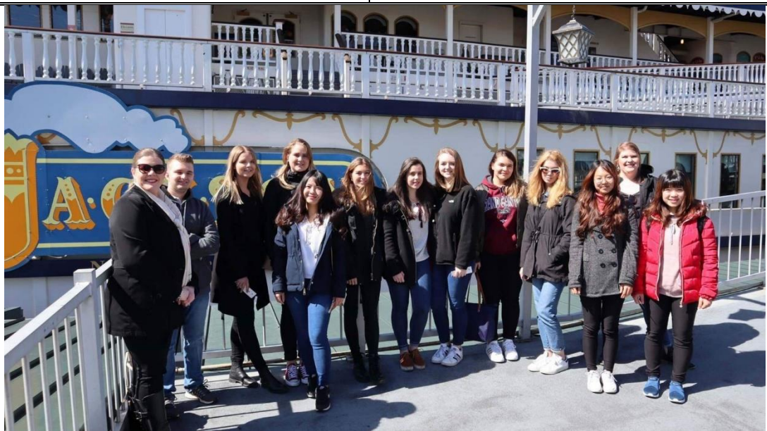
輪船上享用晚餐欣賞鄉村音樂表演