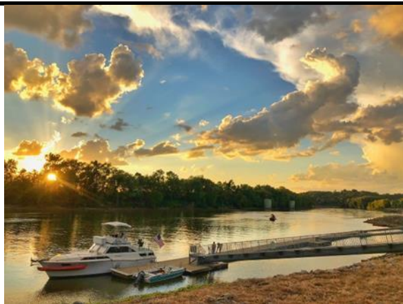
學校附近河畔日落