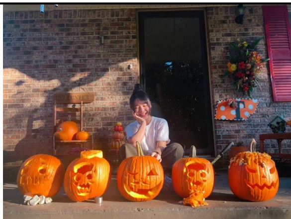
萬聖節南瓜分組比賽