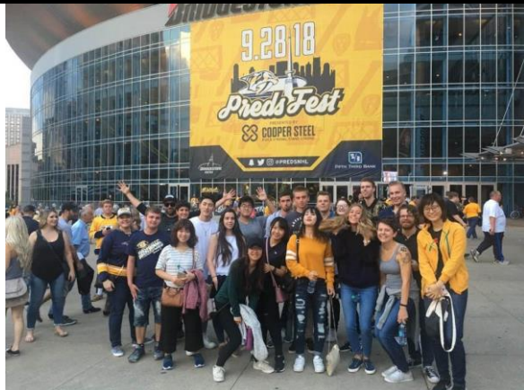
觀看冰上曲棍球比賽